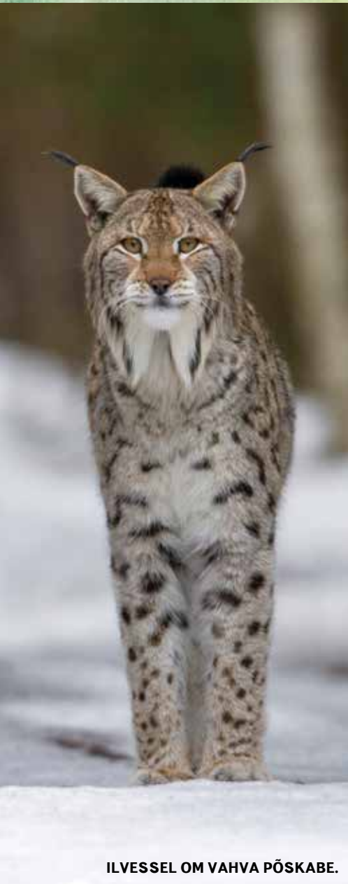
ILVESSEL OM VAHVA PÖSKABE.