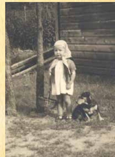
LINNATÜDRUK MULGIMAAL KÄIMÄN

Ku tede vanaemä ja vanaesä väikse latse ollive, sis ollive kah egäpäevätse rööva töistmuudu ku tänapäeval. Kuna poodin olli väegä vähä röövit, sis pallu ömmel iki emä, aga röövatükk osteti küll poodist. Suve ollive