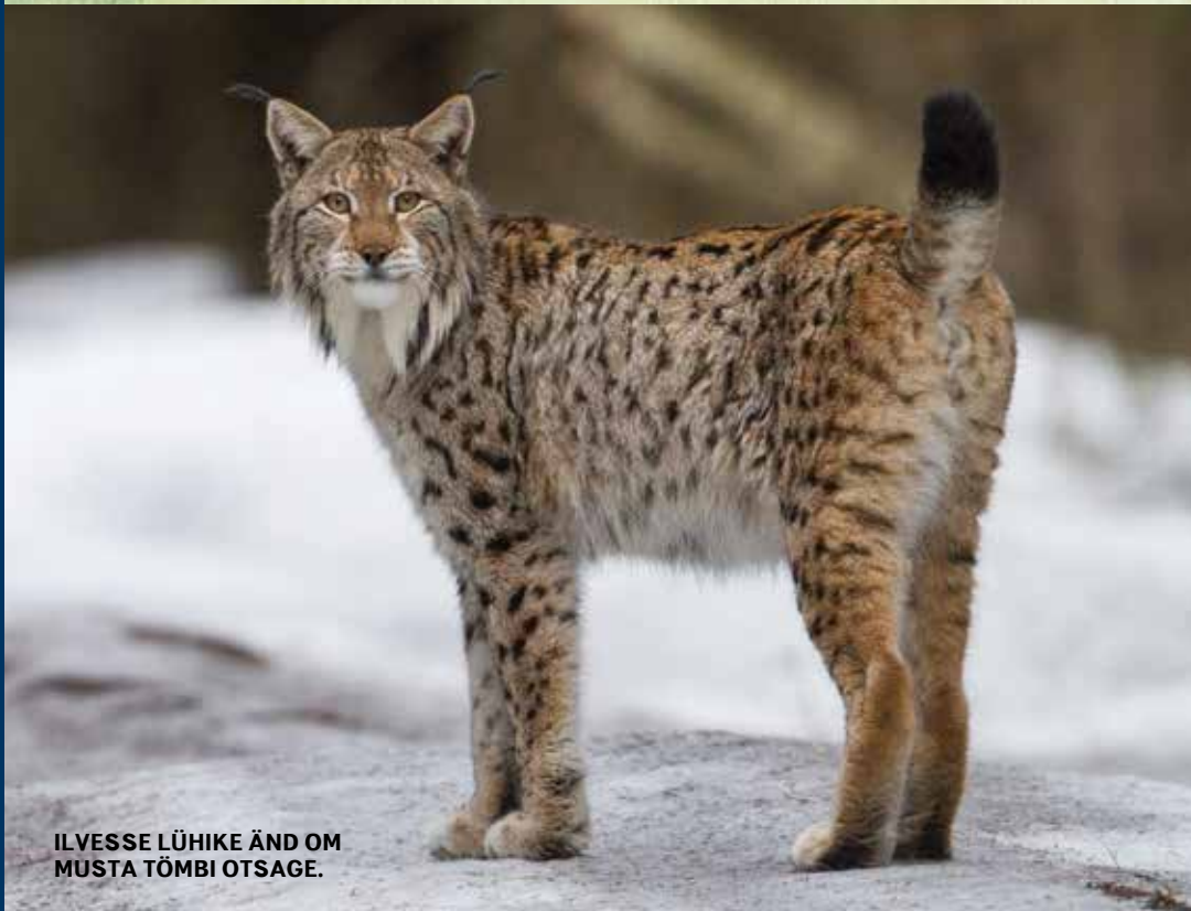
ILVESSE LÜHIKE ÄND OM MUSTA TÕMBI OTSAGE.