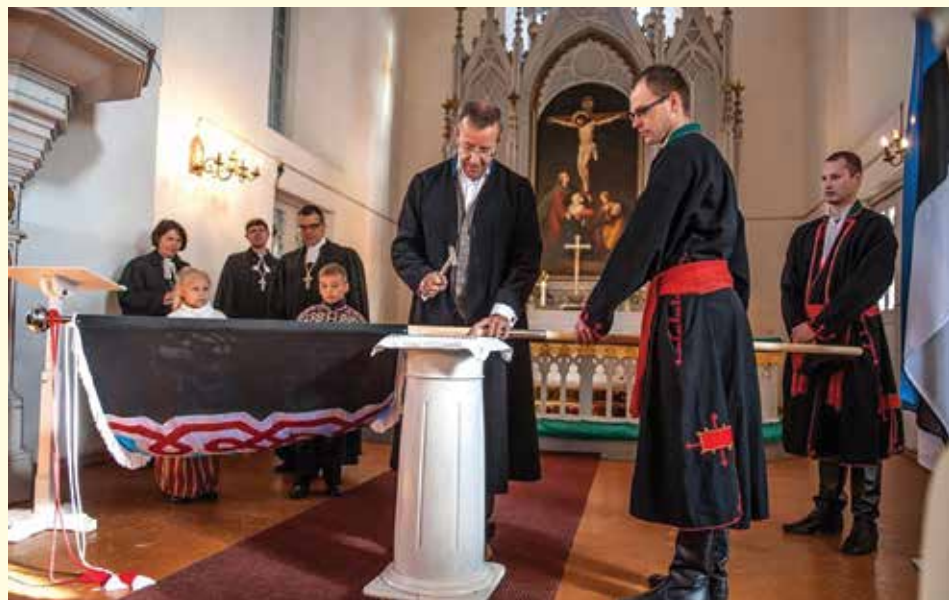
PRESIDENT ILVES LEI MULGIMAA LIPU ÕNNISTEMISE PÄEVÄL LIPUVARDA SISSI ÕBENAGLA.