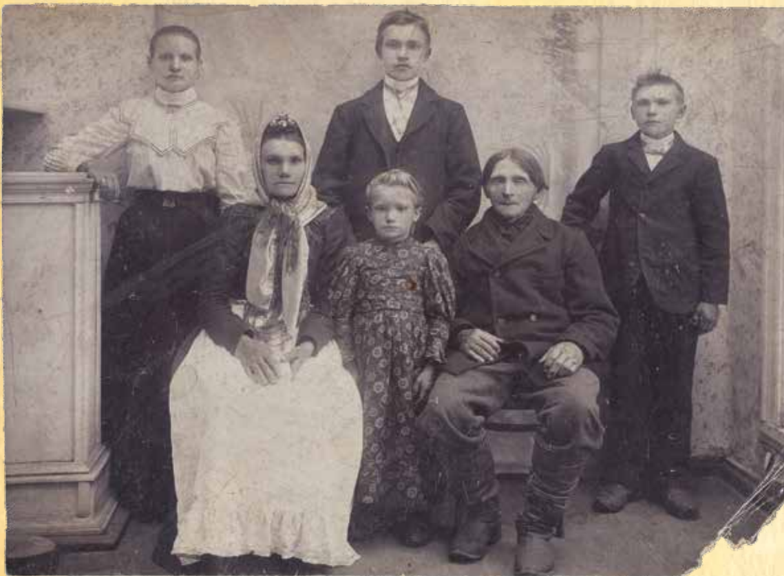
PIDURÕÕVIN MULGI PERE ÜMÄRIGULD SADA AASTET TAGASI

Kui pirlesel aal om laulu- ja tansupidul lastel sellän uhke välläömmeldu rahvarõõva, sis vanal aal sihandest uhkust lastel es ole.