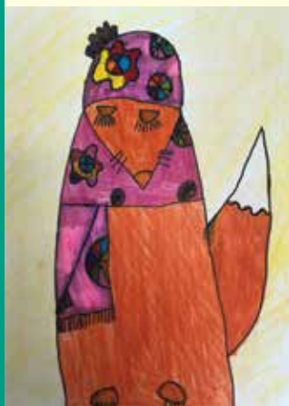
Joonistenu Pulk Kristella