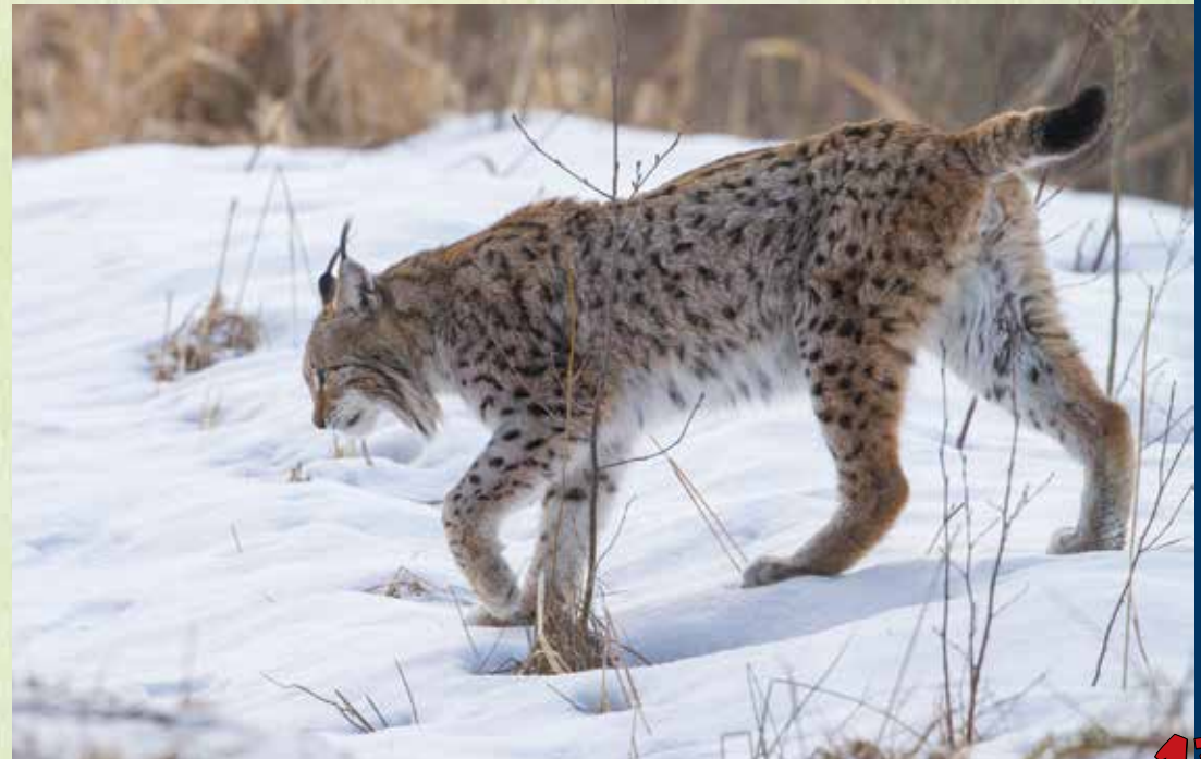
TUMETÄPILINE KASUK AVITEP ENNEST MÖTSAN ÄSTE VARJATE.