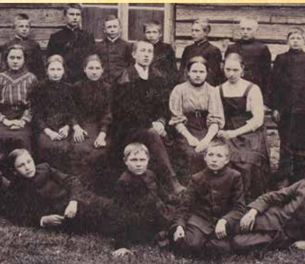
LATSE KOOLIMAJA IHEN

tihti otsi. Vahel tullive nii alle keväde lumedulamise aigu paksu lume siist vällä. Mia mälete, et miul ollive kummiseerigu. Nende sissi sai villätse soki pantu, aga väegä tihti jala külmetive.